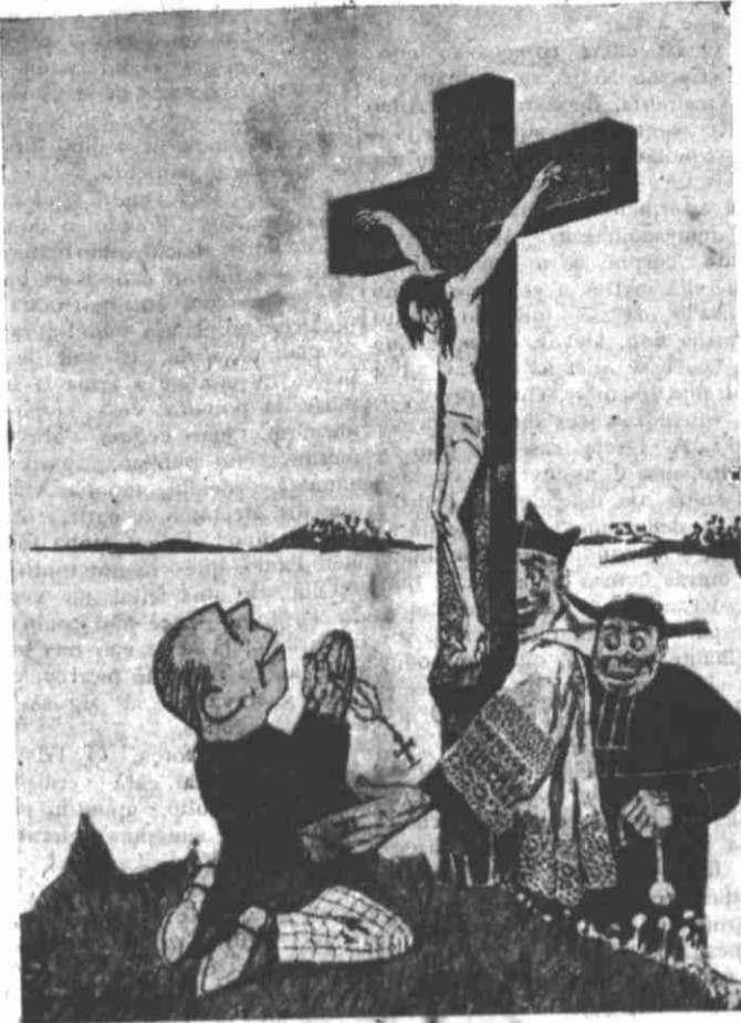
Allivial-me, Senhor, do peso dos meus peccados!